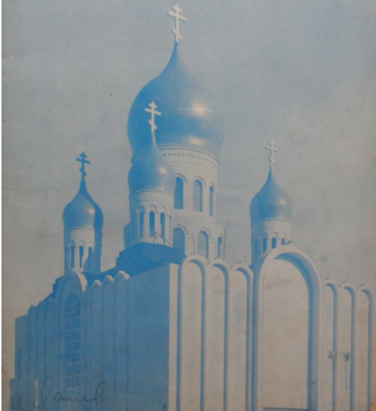
Illustrazione della prima pagina del n.1 della rivista, Nuova Cattedrale Ortodossa Russa in San Francisco (non completata).