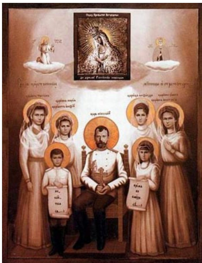
SANTI MARTIRI REALI DI RUSSIA: LO ZAR NICOLA II, LA ZARINA ALESSANDRA, IL PRINCIPE EREDITARIO ALESSIO, LE GRANDUCESSE

Si celebrano anche nel giorno odierno (non presente nel prologo):